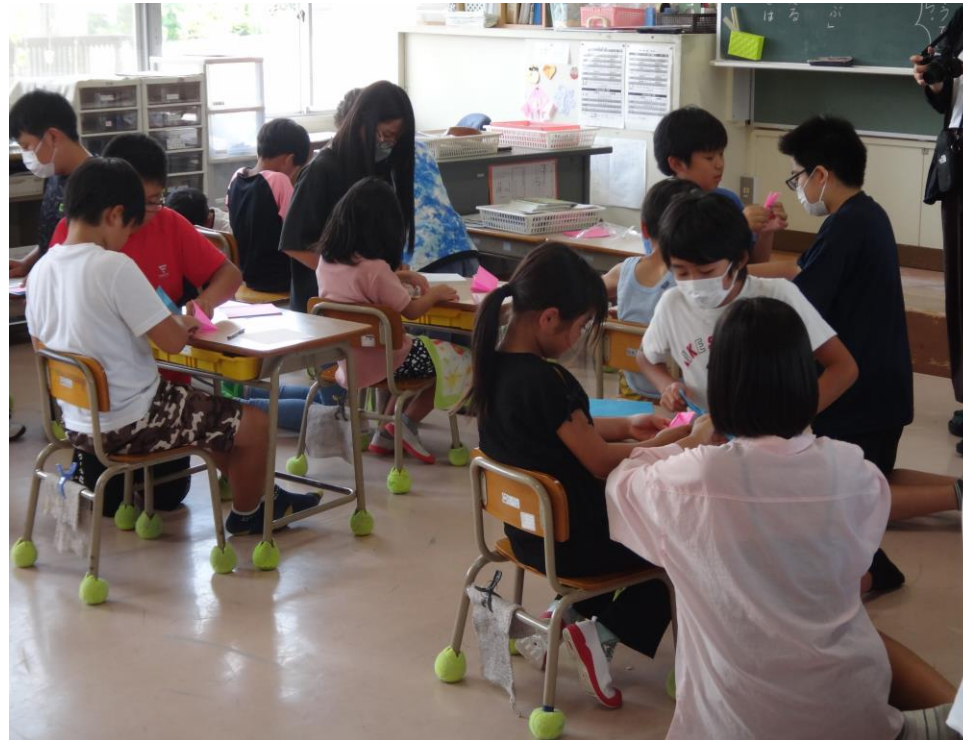
平和への願いを込めて折り鶴を折る子ども達（1・6年生）